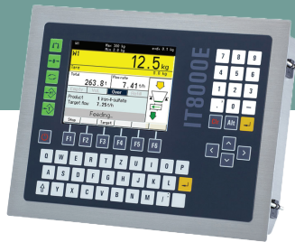
Wegen met kiloweb

Om werkelijk wereldwijd te wegen en de verwerking van uw weeginfo te automatiseren